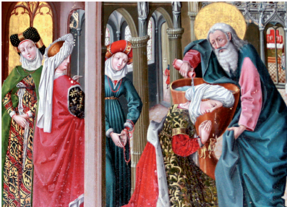
Erwachsenentaufen gab es auch früher, wie hier auf dem Bild aus der Lüneburger St. Nicolai Kirche zu sehen ist.

Ostergottesdienst mit Taufen in der Klosterkirche Lüne