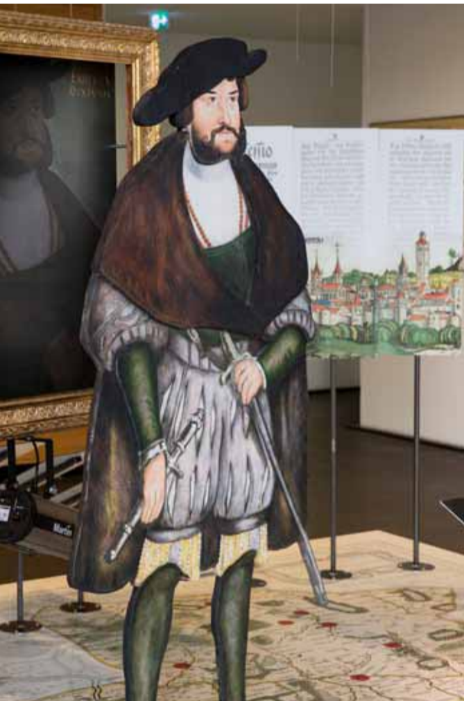
Reformation in der Salzstadt: Herzog Ernst von Braunschweig-Lüneburg.