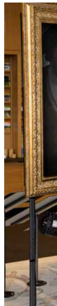
Der Taktgeber der