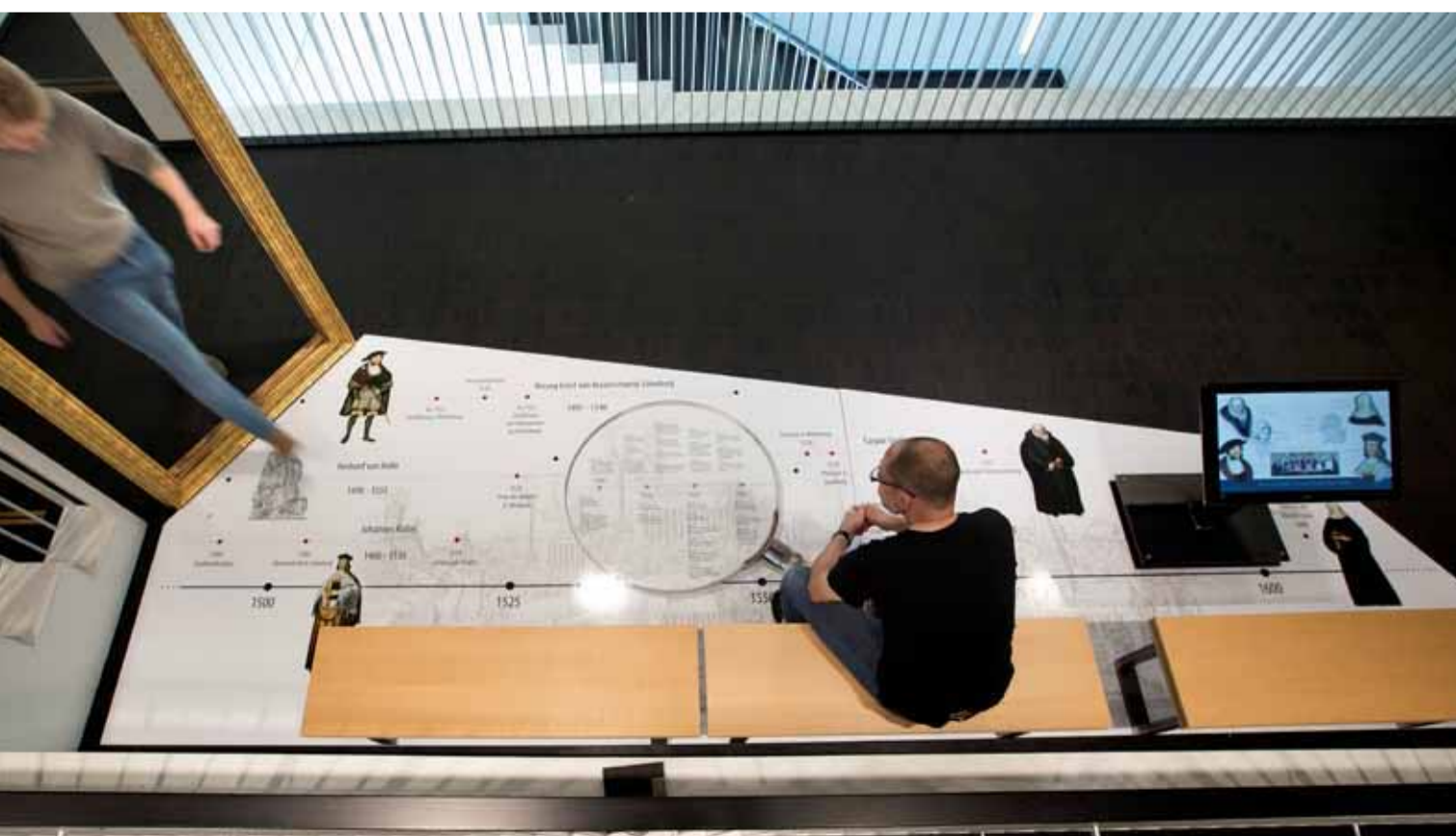
t: Die Zeitleiste zu Füßen des Besuchers ordnet die Ereignisse ein.